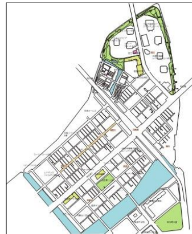
図1 地図から読み取る遊び場