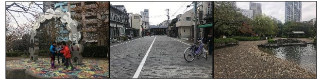
写真1 パリ広場 写真2 山本商店前 写真3 佃公園